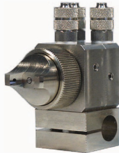
illustration: KA2 à jet plat, connexions sur le dessus (version standard), avec pince (option)